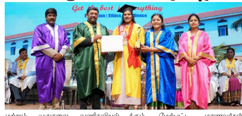
மற்றும் முதுகலை வணிகவியல் க்கும் மேற்பட்ட மாணவர்கள் துறைகளைச் சேர்ந்த 1200 பட்டங்களைப் பெற்றனர்.