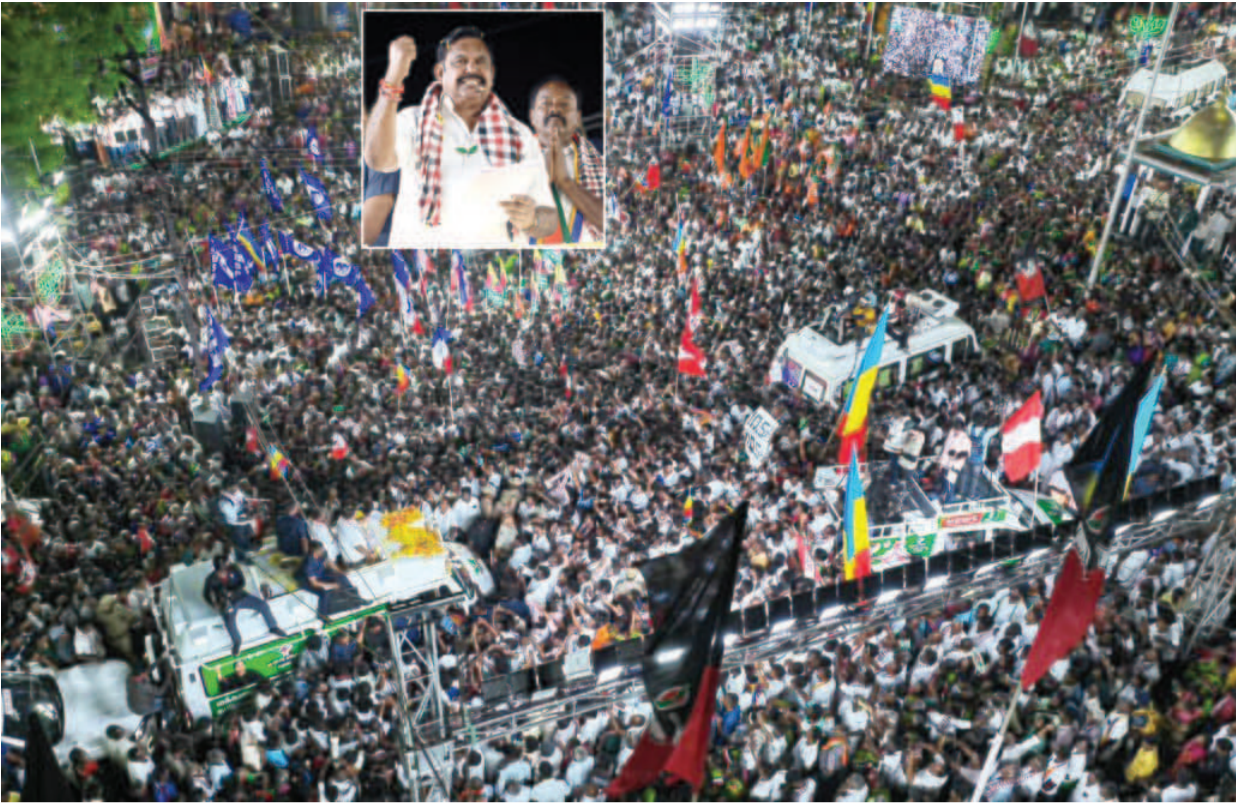
ரூ.24 ஆயிரம் கோடி கையில் வைத்திருக்கிறார்கள்